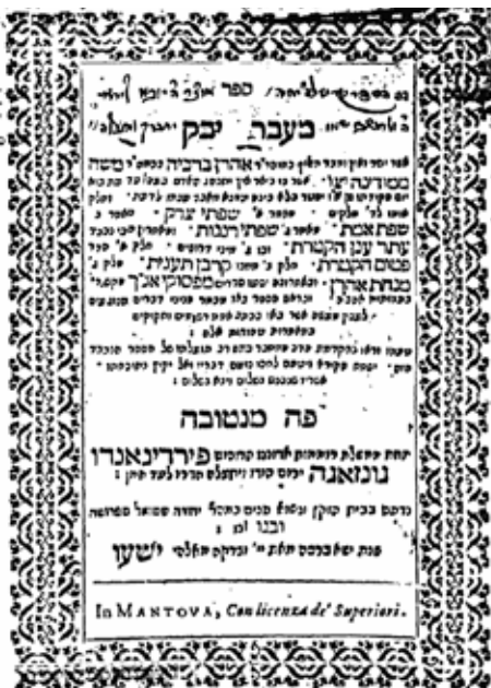
שער הספר 'מעבר יבק' דפו"ר

בשנת הש"ע אנו מוצאים את שליח קהילתם באיטליה בבית רבינו אשר עזר לו רבות בגייט המעות, ואף השתדל אצל הגבירים בעדו. בני הקהלה בצפת שלחו לרבינו 'אגרת תודה' בעוד שלוחם נמצא באיטליא, בה הם מודים לרבינו