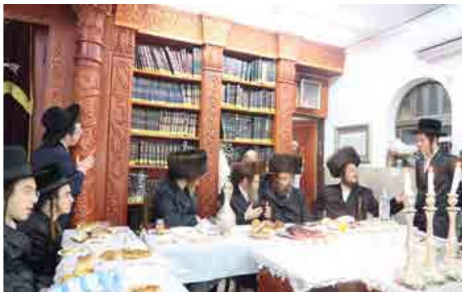
סעודת מלוח מלכא לקראת ההילולא דצדיקא שנערכה בבית מדרשו בשנת תשפ"ג בראשות הרה"צ ממיהלוביץ אדם שליט"א הצדיק.

שנה אחת בעת עריכת השולחן של ההילולא ביקש הרה"ק מריבניץ מהציבור שיהיו בשקט, ואמר שהרבי משטפנשט נמצא עכשיו עמו ממש!!!!