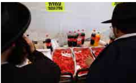
במתחם ההכנסת אורחים של מוסדות שטפנשט בציון הקודש

בעיר היה בית רפואה גדול בפרט לכל תושבי העיר והכפרים מסביב, ומכל האזור היו באים חולים להתרפאות בבית"ה ביאס, סיפר כ"ק האדמו"ר שליט"א מסקולען-ירושלים, כי הוא זוכר שאביו זצ"ל בשנותיו האחרונות כשהיה לו כמה מיוחשים ל"ע, היה אומר, אולי ניסע ליאס - - - כי אצלו היה יאס העיר שיש שם רופאים גדולים. ובעיר יאס התגורר עסקן ידוע שהיה מסייע לחולים מבני ישראל להתקבל אצל הרופאים הגדולים, יום אחד חלתה בתו של העסקן, ועל ידי קשריו ביקר עמה אצל הרופאים הגדולים, אבל הם לא ידעו מה לעשות, מחמת חליה הכבד, ומחמת כן שלחו אותה לביתה כי קצרה ידם מהושיע אותה.