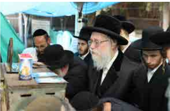
כ"ק האדמו"ר משאץ דרוהבישט ב"ש בציון הרה"ק זיע"א ביום ההילולא

הצדיק משטפנשט האיר האמונה במקומות שהיו חשוכים ביותר, שבעיר יאס היה זה לעומת זה, שכנגד הקדושה של רבינו היה שם הצד שכנגד באופן נורא, שם הוקם הקולנוע הראשון, הצדיק משטפנשט האיר במקומות שהיו חשוכים ביותר, והביא שם ברכה.