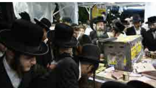
ההמונים בציון הצדיק ביום ההילולא רבה

האבען געבענטשטע הענט, שיהיו לו ידים מבורכות, ואמר שהוא היום רופא מיילד, ולפעמים הדבר תלוי בשניות, שלפעמים גם האמא בסכנה וגם העובר, והוא זוכה לברכה גדולה במעשה ידיו, שנתקיים בו ברכת רבינו.