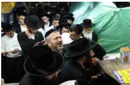
תפילת רבים בציון הצדיק ביום ההילולא

אירע פעם שפרצה שריפה בקצה המרוחק של העירייה. רוח חזקה נשבה והלהבות התפשטו במהירות, מכלות את כל העומד בדרכן ומאיימות לשרוף את כל העירייה שהיו מעץ ולהפוך אותה לתל של אפר.