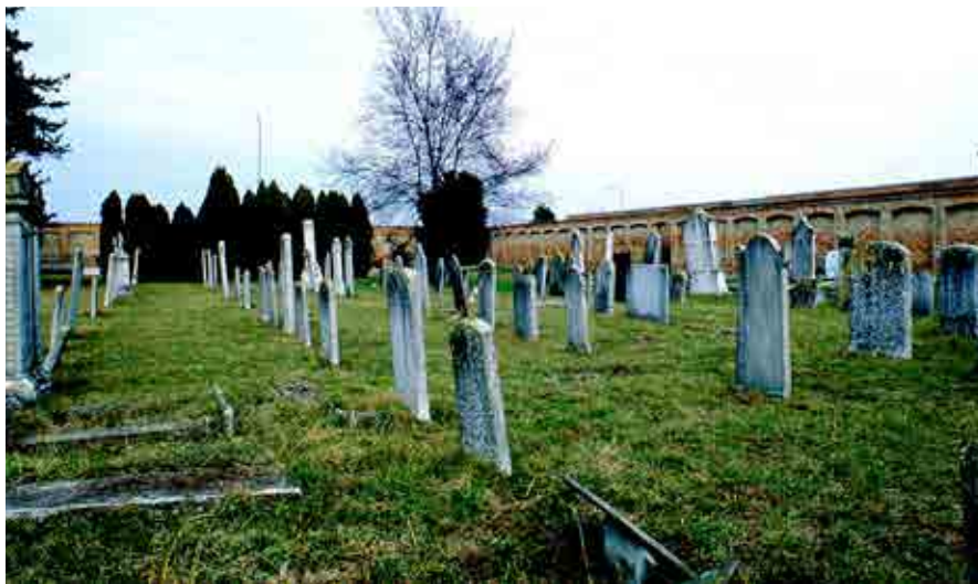
מראה כללי מבית העלמין הקיים כיום במודינא

כוללות בעבודה ושכר הצדיקים, ועלויים אחר המות, שהם החיים הנצחיים, זאת ועוד הרבה פרקים ודרושים הצעתי להקרא לפני חולה בחליו, עד שלא יכביד ראשו ואבריו עליו, ויהיה שפוי לשמוע וליקח מוסר למען ישוב אל ה' וירחמהו וירפאהו או יכוננהו עליו".