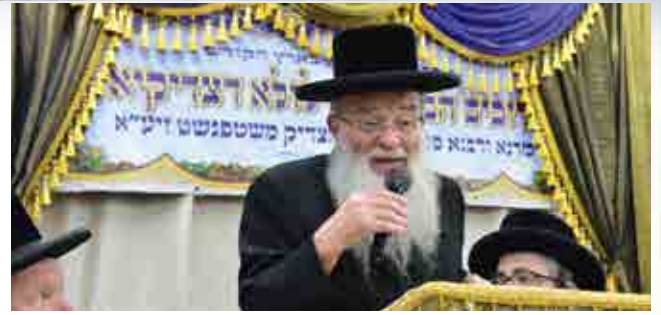
והיו עיניך רואות את מורִיךְ