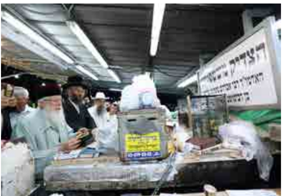
תפילת המקובלים בציון הצדיק בראשות האדמו"ר רבי יחיאל אבוחצירה שליט"א במעמד תיקון חצות מוצאי ההילולא

אספר עובדא שהיה אצל הצדיק, הנה הורי וצ"ל קבורים גם כן בבית החיים בנחלת יצחק, ולאחר פטירת אבי וצ"ל הלכתי לציונו עם אמי ע"ה,