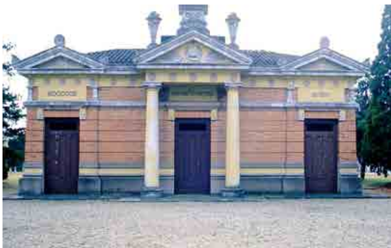
אהל ציון אחד הצדיקים בבית העלמין במודינא

מתיאור זה עושה רושם נכבד מגדולת משפחתו של רבינו שהיו בעלי תורה חכמה ועשירות מופלגת, ומהלכים להם בקרב המלכים והשרים. ומהם יצא חכם דגול בעל שיעור קומה כרבינו.